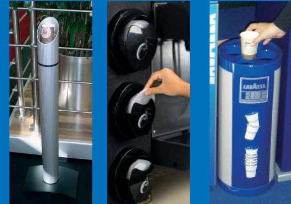
Becherspender | Deckelspender | Bechersammler